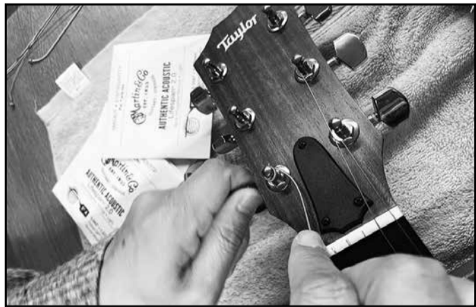
弦交換の様子をパシャリ。Taylor というメーカーのアコースティックギターに、マーチンの弦を張ったそうです。少し太めの弦にして低音の響きを重視。