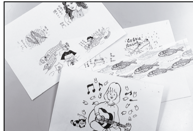
各人、持ち回りで特集記事や新聞部からのお手紙などを担当しています。パソコンで原稿を書く人、手書き原稿を好む人。イラストも素朴なペン描きです。味があっていいかと……。