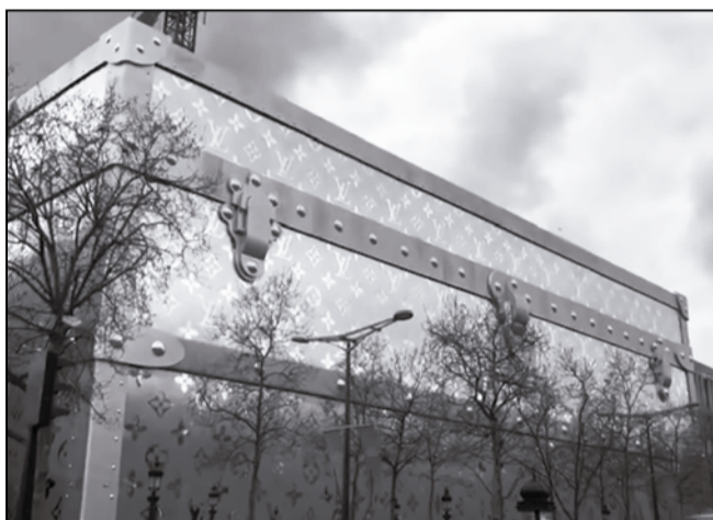
フランスを旅行したとき、シャンゼリゼ通りを歩きました。有名なルイ・ヴィトン本社があり、真横にはルイ・ヴィトンのマークを散りばめたバックを大きくした建物が。これにはビックリしました。機会があれば是非。ヴィトンだけでなく、ブランド品は男性には興味薄かもしれませんがね。 <こよなく愛するオレンジユニホーム>