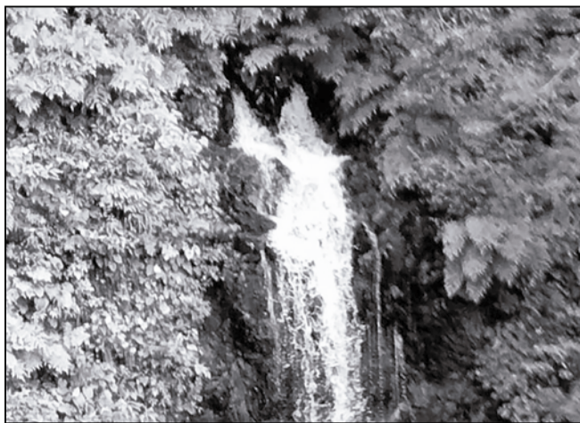
もう鼻水が止まらない？ そうこれは黒部市布施川上流に位置するその名も鼻の滝。何ともユーモラスな形をした滝なのですが、暑い夏の盛りでも冷気が体を包みます。正に天然のクーラー。この夏暑さしのぎにエコを上手に取り入れましょう！ <鼻高々>