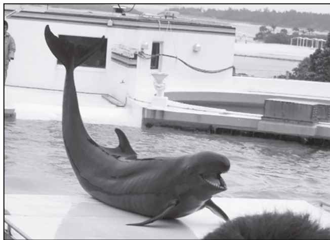
イルカより巨大なオキゴンドウ。随分前に国営沖縄記念公園へ行った時にパチリ。口と歯が大きくてコワモテ顔だが、好奇心や理解力、コミュニケーション能力が高い。人によく慣れていて利口なクジラです。気分爽快な強力ジャンプをします。 <沖巨頭>