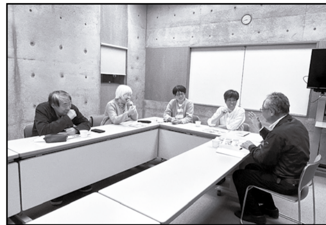
黒部本部5名、関西支部1名でこの倶楽部通信を編集しています。「雑談に花、校正に刃」は月に1度、カラーレの会議室で繰り広げています。この写真は雑談花盛りの模様です。