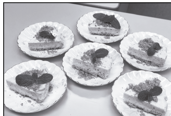
毎月、このおやつタイムが楽しみ！今回は「手作りレアチーズケーキ」が登場。スイーツで至福の時の後は、恒例の次回おやつ当番ゲーム。過去には連続4回（4ヶ月）当たった人も。