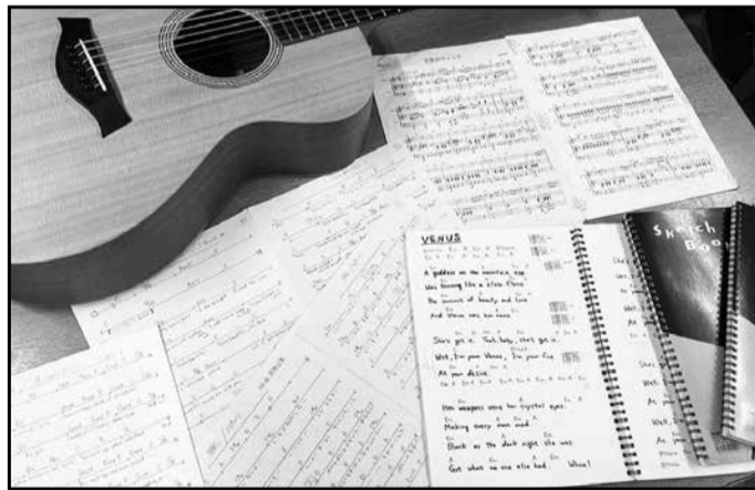
譜面の数々です。邦楽、洋楽とメンバーが各々弾きたい曲をコード譜にしています。年代も様々で、1960 年代～2000 年代と、幅広いレパートリーをお持ちです！